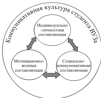
Рис. 1. Теоретико-экспериментальная модель структуры коммуникативной культуры будущего специалиста.

Исходя из данной модели структуры коммуникативной культуры будущего специалиста, необходимо способствовать формированию каждой из вышеупомянутых составляющих, уделяя особое внимание индивидуально-личностной составляющей, в частности ее компоненту – прижизненным достояниям личности, который содержит идеалы, установки, ценности, моральные качества и этические нормы, без которых невозможно формирование как полноценной высокодуховной личности, так и будущего специалиста-профессионала.